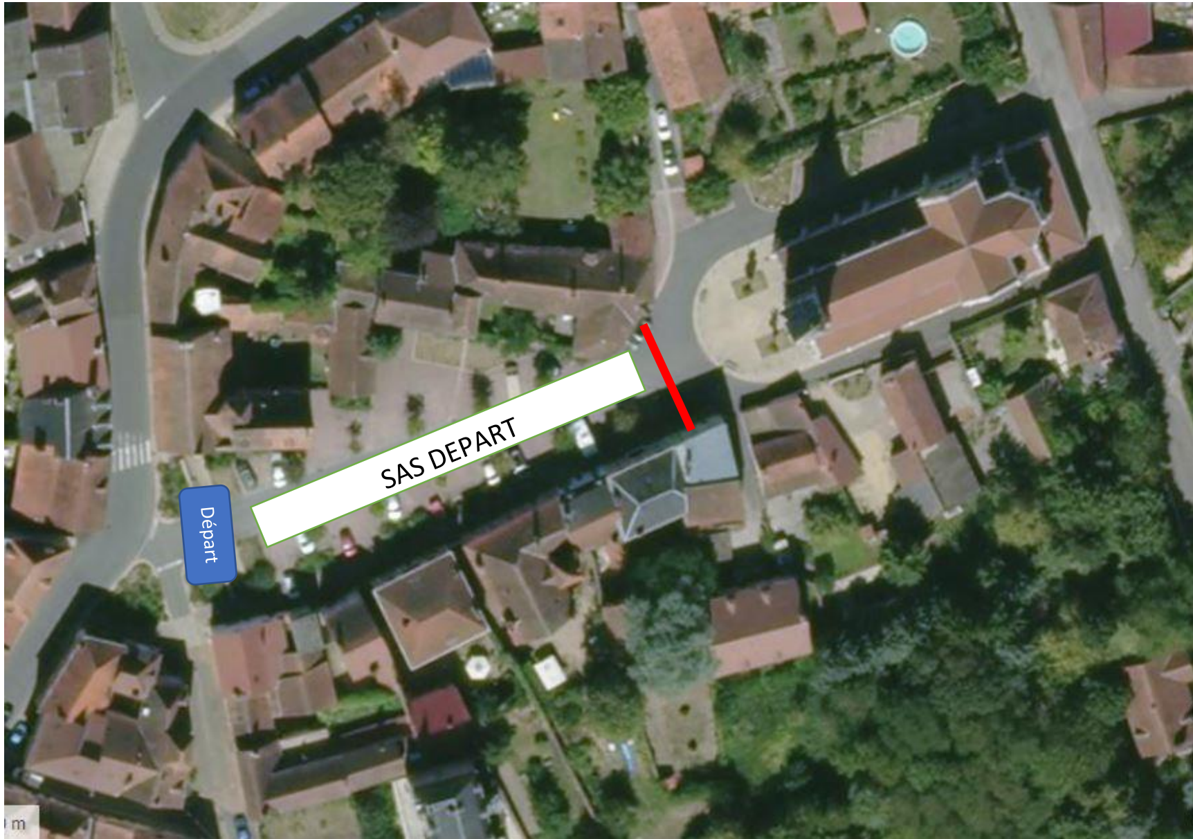
TRAIL CHANTELE SPORTS NATURE