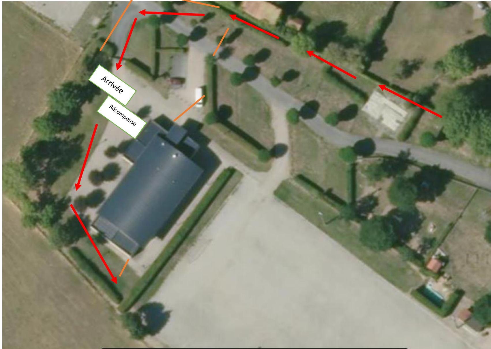
TRAIL CHANTELE SPORTS NATURE